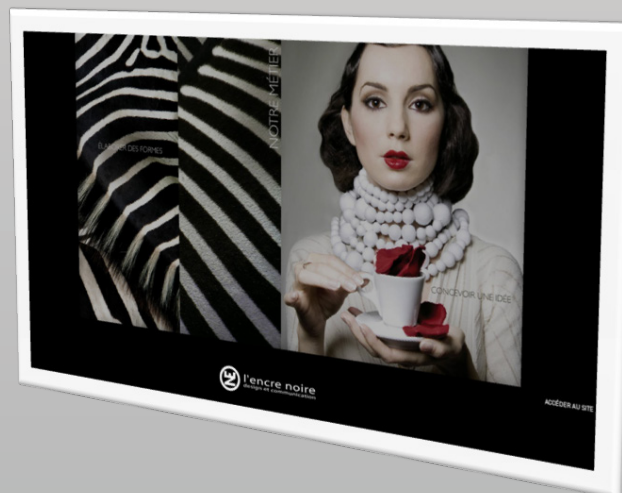
Site internet de LA Encre Noire

La boîte dispose également d'une très bonne visibilité sur Internet, bénéficiant d'un site vitrine arrivant en tête ou en première page dans les moteurs de recherche avec certains mots-clés en relation avec leur domaine d'activité accompagnés du mot-clé « Saint-Raphaël », ce qui n'est pas négligeable si elle souhaite attirer des clients préférant s'offrir les services d'une agence web au niveau local, peut-être pour une meilleure confiance.