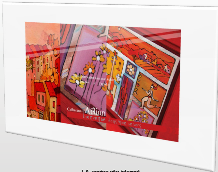
LA ancien site internet

La directive fondamentale était de réaliser ce site internet sur la plateforme de micro-blogging Tumblr, afin d'apporter un aspect communautaire qui semble légitime pour une artiste souhaitant faire partager ses œuvres sur le web.